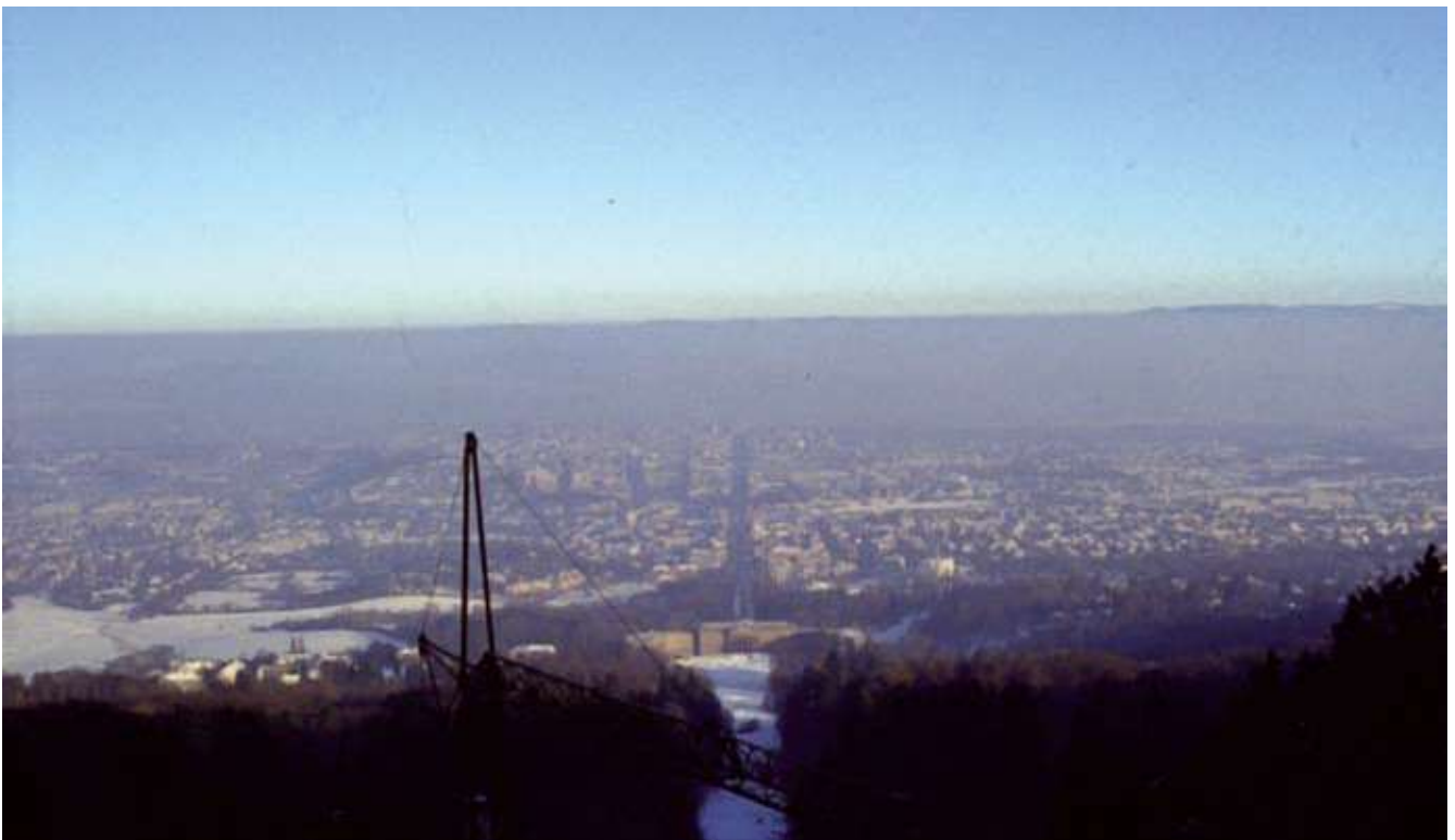
Inversion über dem Kasseler Becken, Blick vom Herkules

Länder gezwungen Luftreinhaltepläne aufzustellen und Maßnahmen zur Einhaltung dieser Werte vorzuschlagen. Die Umsetzung der Maßnahmen liegt dann in der Kompetenz der Kommunen, welche die Ländervorgaben ausfüllen müssen. Kommunalpolitiker könnten somit aus den Vorgaben des Luftreinhalteplans konkrete Schritte in der Verkehrsplanung oder der Gebäudesanierung vollziehen. Wenn das nicht geschieht, also die Grenzwerte nicht eingehalten werden, sind die Bürger nach den neueren Gesetzen berechtigt zu klagen, was bei Nichteinhaltung emp-